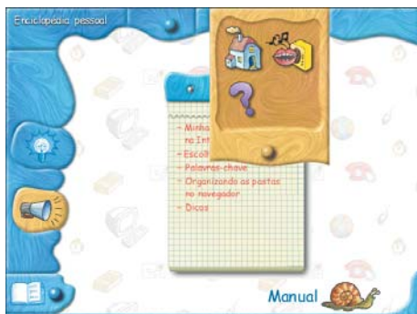
Visual do CD-ROM não chama muito a atenção da criança

1 O que é a Internet? — Mostra como esse universo virtual nasceu, o que se pode encontrar nele e os conceitos básicos para conhecê-lo melhor.