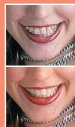
Foto da gata

A modelo (a mesma da edição 70 – lembra da enfermeirinha?) usava aparelho ortodôntico na ocasião da foto. O aparelho foi removido clonando-se partes dos dentes com a ferramenta de carimbo (Stamp) e um brush estreito.