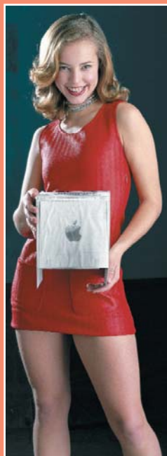
Foto do Cubo