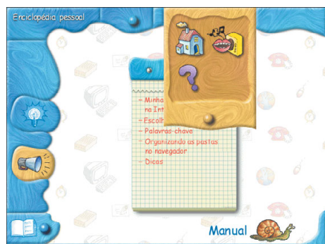
Visual do CD-ROM não chama muito a atenção da criança

1 O que é a Internet? — Mostra como esse universo virtual nasceu, o que se pode encontrar nele e os conceitos básicos para conhecê-lo melhor.