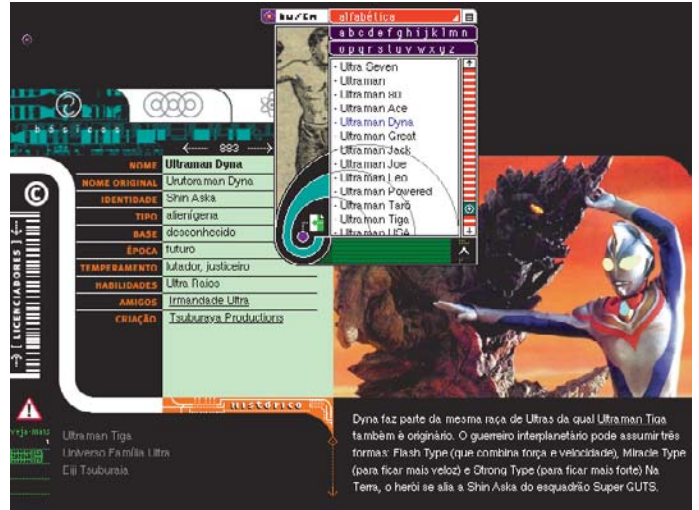
A ferramenta de busca ajuda a achar o Ultraman que você quer

Takeuti (Sailor Moon) e Jack Kirby (Capitão América, Thor, X-Men, Hulk, Quarteto Fantástico etc. etc. etc.). “Universos” explica as origens de grandes grupos como Heróis Brasileiros, DC, Marvel, Star Trek, Star Wars, Street Fighter e Família Ultra. Mas o filé está nos “Verbetes”, divididos em Básicos (ficha completa de cada herói e sua aparição na TV, cinema, HQ e outras mídias), Equipes (dispensa explicação) e Astros (galãs que representaram personagens famosos). A parte dedicada ao conteúdo já publicado na revista ganhou uma interface que lembra o shareware Bunny Killer, onde um coelhinho cruzava a tela fugindo do clic certo do mouse. Agora são bolinhas que jogam o leitor aleatoria-