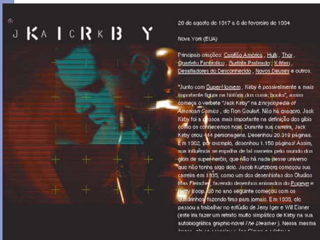
Santo Kirby, que estais no céu, rogai por nós, pecadores...

mente ao conteúdo das matérias principais. Cool! As buscas podem ser feitas de forma Genérica (digitando uma palavra) ou Alfabética. Qualquer palavra do texto pode ser duploclicada para fazer surgir um menu flutuante que mostra suas variações e onde se encontram mais ocorrências da expressão. Fino, o CD abre com uma citação de “O Poder do Mito” de Joseph Campbell, mas a abordagem divertida e a interface agitada mos-