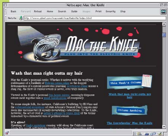
O que esse cara está querendo dizer mesmo?