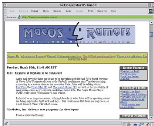
Se você procura um bom boato, vá ao Rumors

Essa é uma tradição no jornalismo de Mac que se exacerbou nos últimos tempos. Até parece que todo empregado que a Apple demitiu resolveu se vingar da empresa montando seu próprio site de boatos. Todos eles têm suas "fontes exclusivas" dentro da Apple e são alimentados por leitores e espíões espalhados pelo mundo que enviam para os organizadores do site suas dicas e descobertas. Enfim, se você quer saber qual a última empresa que estão falando que vai comprar a Apple (no momento em que este artigo estava sendo escrito, a bola da vez era a Disney) ou qual é o novo e insanamente grande produto que está sendo desenvolvido nos porões de Cupertino, abra seu browser e navegue pelos sites abaixo.