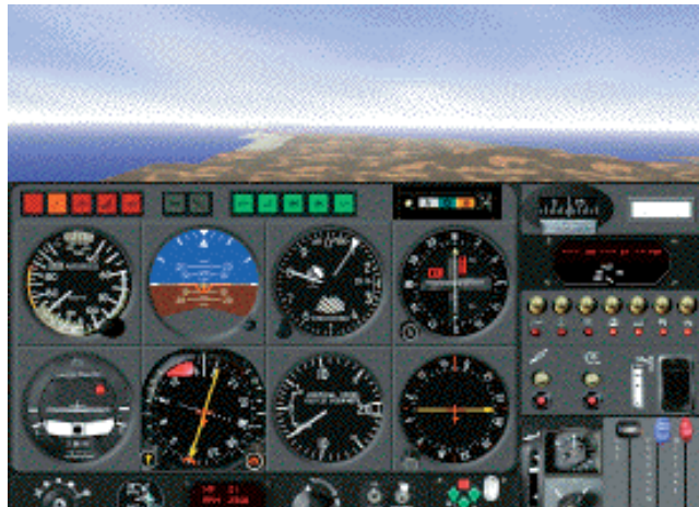
Esse jogo é perfeito para os loucos por um manche

A próxima tendência em simuladores de voo devem ser os jogos descritos como “instrutores virtuais de voo”. É assim que a alemã Cat III Systems vende seu Virtual Wings. Exclusivo para Power Macs, o simulador utiliza a tecnologia QuickDraw 3D. Muito modestamente, a empresa vangloria-se de ter produzido “o cockpit mais realista jamais modelado”, que precisa de, no mínimo, três monitores para ser usufruído em toda a sua plenitude. O Virtual Wings é vendido por US$ 105 e requer um monitor bem