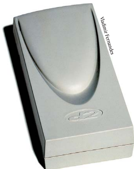
Este é o bicho

Isso mesmo! Um radinho FM pro seu Mac! Na realidade é um dos aparelhos para Mac mais práticos e simples que já vi, e que por sinal funciona muito bem, graças à boa idéia da empresa LaCie (mais conhecida no mercado pelos seus hard disks e scanners). O "equipamento" todo se resume a uma caixa com uns 11 centímetros de comprimento por uns 5 de largura e mais uns 2,5 de altura,