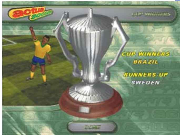
Como em 58, o Brasil massacrou a Suécia. Aaah, eu tô maluco!

ção de games de Mac. Como ele funciona e se está dando certo, ainda é uma incógnita. Apesar de todos esses defeitos, Actua Soccer pode ser bacana, se você esquecer o jogo em si, entrar no clima da simulação e tiver paciência para treinar e aprender a jogar direito. Ele pode ser jogado entre dois jogadores que se acotovelam em cima do teclado ou em disputas via rede, que torna tudo muito mais divertido e em condições mais justas do que nos certames contra o Mac. Uma das coisas interessantes é que você pode