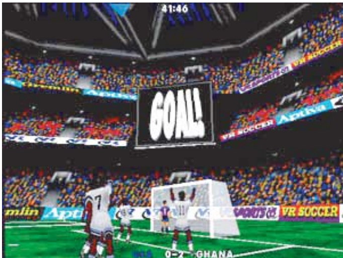
Cruzamento na área, olha o perigo... e o gol! Goooooooooooooooooool