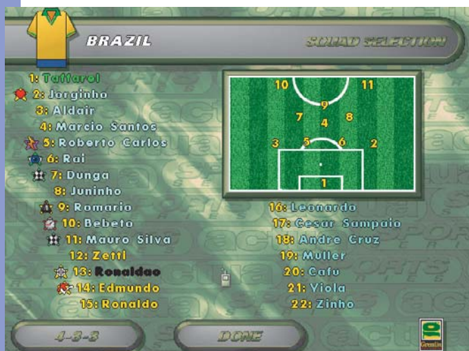
Em atenção para a escalação do Brasil, é com você Galvão...

Sinistro... muito sinistro. O visual de Actua Soccer é bem razoável, com estádios cheios, telão e boas animações. O jogo tem narração em inglês ou francês, que você pode escolher na hora de instalar. Actua Soccer só funciona em PowerMac rodando o Sistema 7.5.3 para cima, com um mínimo de 8Mb de RAM e a instalação mínima ocupando uns 20 Mb. Quanto à documentação e informação na embalagem, o jogo deixa muito a desejar. Dentre as coisas instaladas, está o Apple Game Sprockets™, a nova tecnologia desenvolvida pela Apple para acelerar a produ-