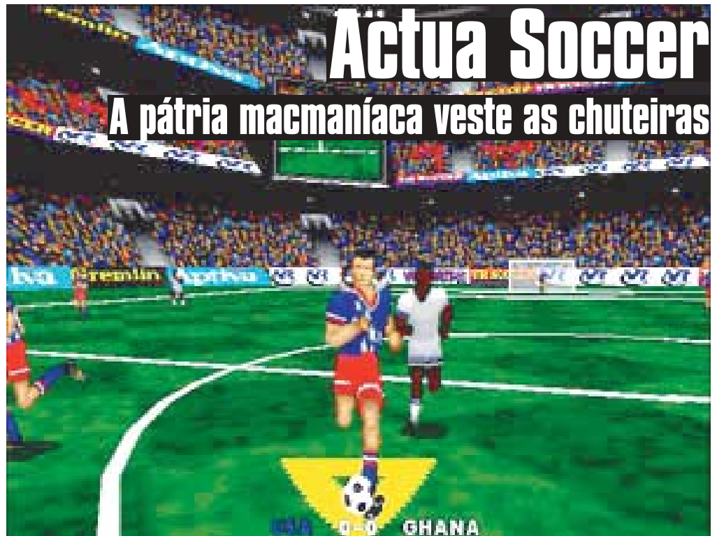
O gramado é verde, a bola é branca e as bandeiras estão tremulando, tremulando...

controlar os jogadores e ter um domínio sobre as jogadas. A enorme quantidade de câmeras é bonitinha, mas ordinária, dificultando a movimentação e os passes. O único jogador em quem você pode confiar é justamente aquele que você controla, o que torna as coisas muito difíceis, principalmente na hora da defesa. São 44 seleções do mundo com jogadores reais que possuem suas características específicas, que, é claro, não batem muito com a realidade. Para se ter uma idéia, Edmundo aparece como o jogador mais disciplinado do Escrete Canarinho e Ronaldão, como o mais preciso.