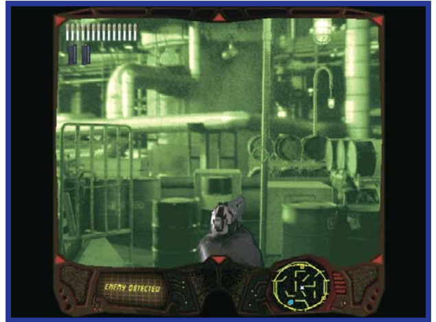
Passa fogo nos agentes inimigos no melhor estilo BloodBath

Além do PDA, seu espião tem à disposição uma workstation cheia de softwares de análise, réplicas dos usados por agências de informação. Cada um vem acompanhado de explicações de funcionamento e utilização, servindo para solucionar problemas. O KAT (Kennedy Assassination Tool), por exemplo, é um modelo de computador que serve para rastrear a trajetória da bala e localizar o atirador.