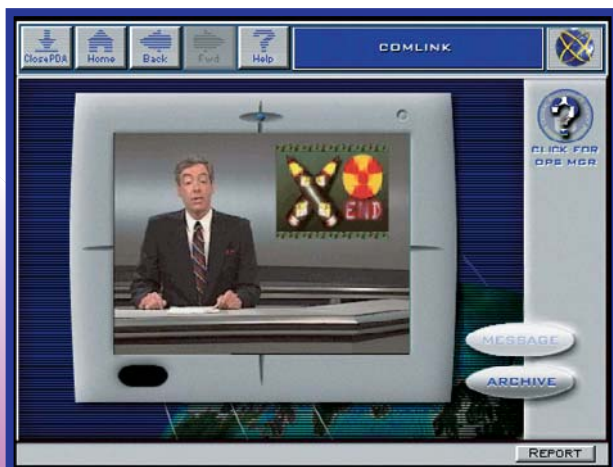
Que Netscape que nada! O quente é o browser espião da Comlink

Outras ferramentas vão sendo carregadas no computador à medida que você avança no caso: o Mix & Match, para retrato falado do suspeito e pesquisa em banco de dados, o Cypher, decifrador que permite quebrar códigos, e o PhotoDoc, que permite falsificar fotos, entre outros.