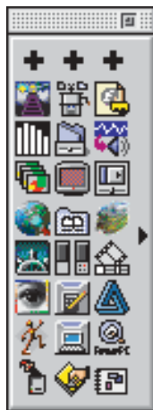
Desktop Strip com HandyMan

Meio-Editor de arte da MACMANIA. Trabalha ouvindo Tangerine Dream e The Future Sound of London. Tem uma mandala presa na parede atrás do Mac.