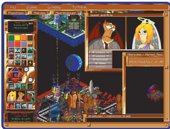
Sinta-se Deus e o Diabo numa terra distante habitada por almas de aliens

Se você é um fanático por jogos tipo SimCity, AfterLife será uma boa aquisição para a sua coleção. Mas se você acha esses jogos um tanto parados, esqueça. Até quando comparado com outros jogos do gênero, AfterLife anda muito devagar. Mesmo com o tempo ajustado para o mais rápido,