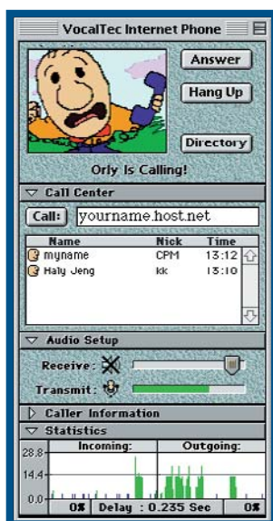
Aiô, aiô, responde...

alguma coisa pra ver se o volume não está muito alto ou muito baixo. Outro erro comum é falar com a boca no microfone ou ficar berrando. O I-Phone não roda se a memória virtual ou algum duplicador de memória, como o RAMDoubler, estiver ativado. Também é recomendado que