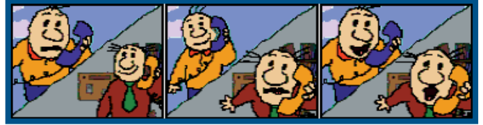
Essas animaçãoezinhas toscas dão o clima do programa. Que deprê!

Parecido com os serviços de Chat, com o I-Phone o usuário cria seu pró-