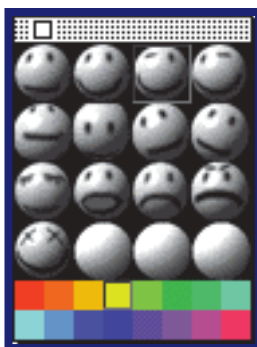
Escolha sua cara nesse box

O avatar é totalmente customizável, você pode usar a aparência default , uma bolinha com dois olhos e uma boca, que tem 13 expressões faciais para representar seu estado de espírito, ou criar seu próprio avatar a partir de uma foto sua ou do que sua imaginação mandar. Existem ainda uma série de acessórios ( props ) para dar um toque pessoal na sua aparência: cabelos, chapéus, óculos, chifres, etc. Se você quiser acessórios exclusivos, o programa ainda oferece um editor de acessórios.