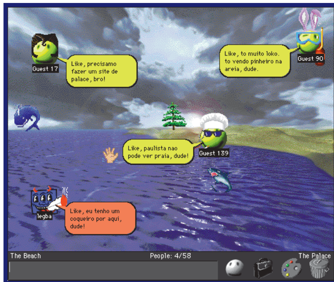
Cyberluiu da turma da MACMANIA. Os gringos não entenderam nada