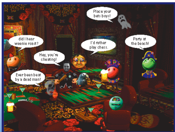
Já dá para jogar dama, gamão, xadrez e geekionarie. Só falta ping-pong

Ao contrário de outras tecnologias de chat multimídia (como o AlphaWorld, que só existe para PC), o Palace evitou utilizar gráficos 3D para simular um "espaço virtual" em troca de uma maior interação entre os participantes. A coisa é muito divertida e fica cada vez melhor conforme você vai aprenden-