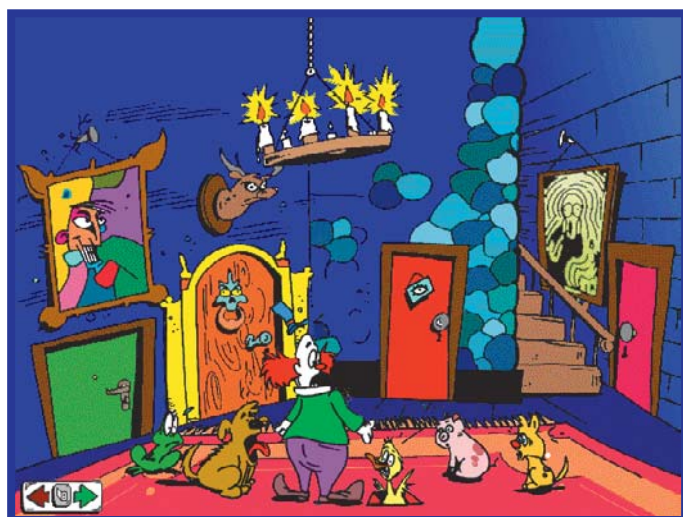
A bruxa sempre sacaneia com a turma. Nessa vez foi o Duck que se deu mal