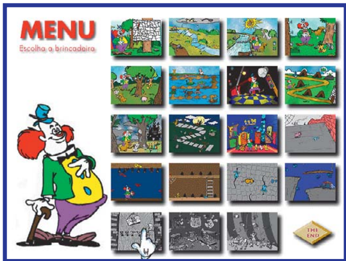
Só se você completa a brincadeira o Puffy te deixa entrar no próximo jogo

Em cada brincadeira os personagens repetem o vocabulário para ajudar a guardar os nomes dos bichos, as cores, os números e algumas palavras como run , stop e jump . É uma pena que não dá para ouvir novamente como se fala a palavra depois que os personagens já