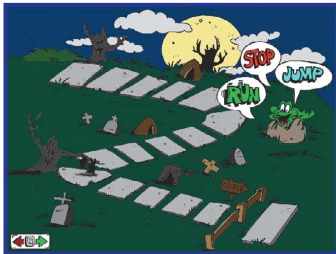
Não caia no papo do sapo. Pare um pouquinho antes dele mandar, senão...