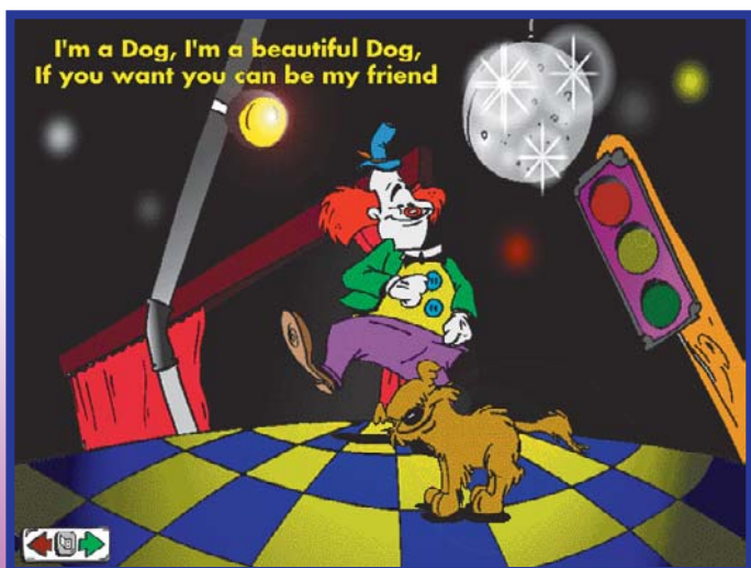
A pronúncia é o problema. Quase não dá para entender as falas do cachorro