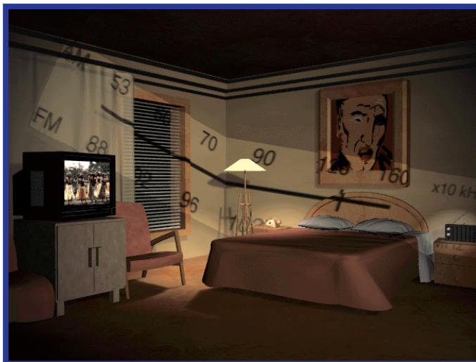
Recuse imitações, os legítimos CD ROMs de músicas sempre tem uma cama

Apertando Control-Space Bar em qualquer ponto do CD-ROM, você vai para a sala de controle, onde pode regular o volume da música e dos ruídos, voltar para onde estava, ir para o corredor inicial, ou sair do CD-ROM (o \mathbb{H} -Q funciona também). Apertando Esc você vai para uma sala que lembra um sótão escuro e desarrumado. Clicando determinados objetos, você é levado para várias salas do CD-ROM. Na verdade, essa é só uma alternativa de navegação que te leva aos mesmos lugares que o corredor. A parte do som é hors-concours : música, ambiente, falas e ruídos se unem com uma harmonia rara em CD-ROMs, de maneira que até o silêncio, quando ocorre, parece fazer parte de uma obra concisa. Mesmo quando o programa está carregando algo do CD, tem sempre uma gravura acompanhada de um som pra entreter durante a espera. Quem conhece Laurie Anderson, vai perceber com certeza que este CD é uma continuação e um complemento do trabalho de pesquisa sonora e ambiental que ela vem desenvolvendo há 20 anos. Sem dúvida a melhor parte do CD-ROM, depois do som, são os gráficos, feitos pelo designer Hsin-Chien Huang. São desenhos e cenários fantásticos sempre escuros e que, na maioria das vezes, não tem aquele jeito batido de computação gráfica. Outros pontos quentes são: a visita ao palco do show Bright Red ciceroneado pela própria Laurie; o estúdio de gravação, onde você pode incluir falas suas às músicas