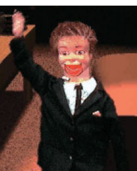
Laurie versão Thunderbirds