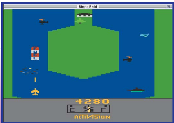
Que FA-18 que nada, o grande barato é detonar tudo no River Raid