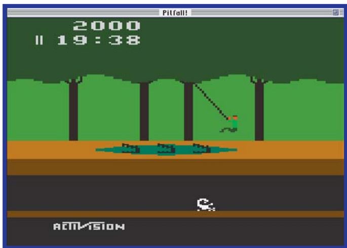
Pitfall alucinou a galera com seus jacarés, escorpiões e pedras rolantes