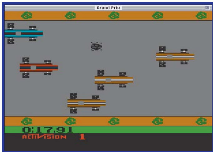
Capenguêsimo, o Grand Prix não é nenhum Enduro mas dá para o gasto

E a Activision foi a empresa de software responsável por alguns dos maiores clássicos desta era. O Action Pack reúne 15 deles num fenomenalmente subaproveitado CD-ROM ocupado com parcos 5 megabytes. Mas que valem como 5 megatons de nitroglicerina pura! Além de ser o modo mais cult de subaproveitar a potência daquele Power Mac 9500 que você acabou de comprar. Relative aquela velha testosterona com os imortais River Raid , e Pitfall! ou com os