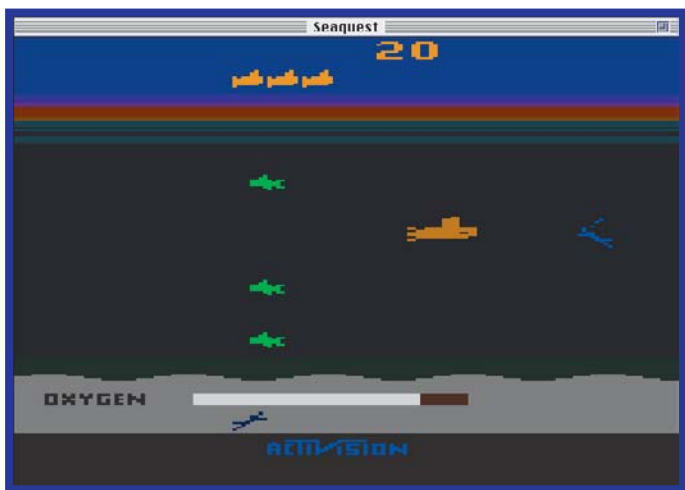
A movimentação frenética do submarininho atrasou muito almoço