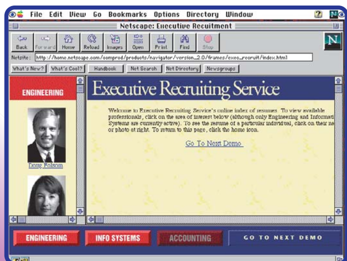
Barras de scroll e botões fixos são algumas das novas bossas do Netscape

Com essas mudanças e mais algumas melhorias na interface, o Navigator deixa ainda mais para trás seu principal concorrente, o NCSA Mosaic. Para os interessados em experimentar o Netscape 2.0, é bom lembrar que a versão disponível na