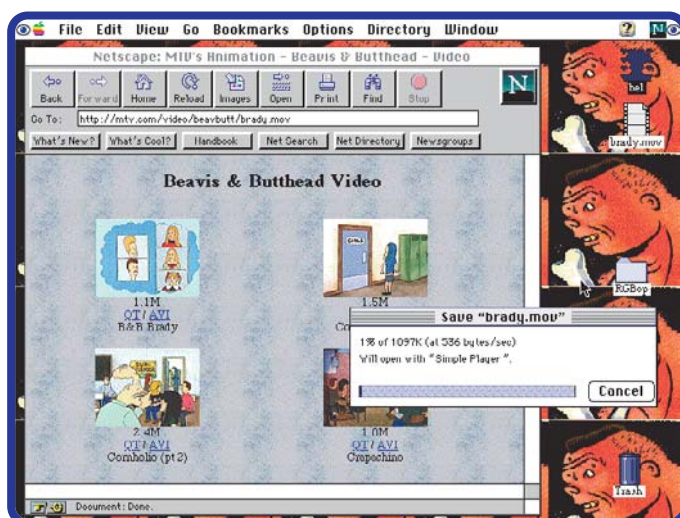
Agora essa barrinha de download fica voando na frente da tela, chato, né?