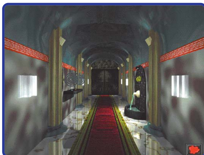
Este é o “Caminho dos Fortes” que devia se chamar “Caminho dos Pacientes”