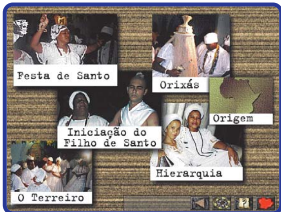
Mate a curiosidade visitando um terreiro em QuickTime