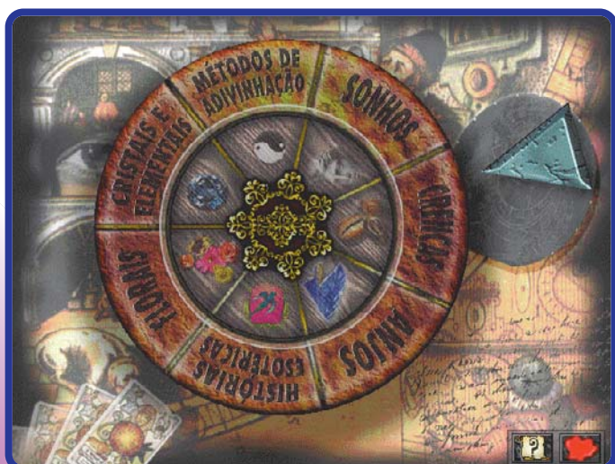
Vocês não acham que a tal da interface-mandala tem cara de “Koletrando”?